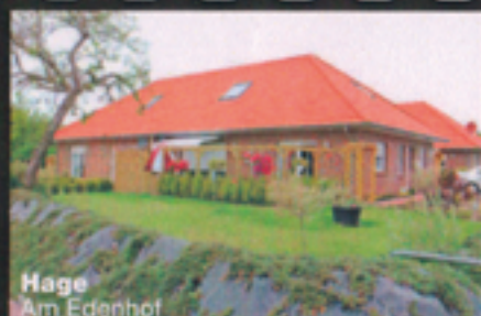
Hage Am Edenhof