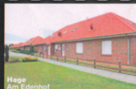
Hage Am Edenhof