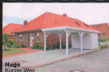
Hage Kurzer Weg